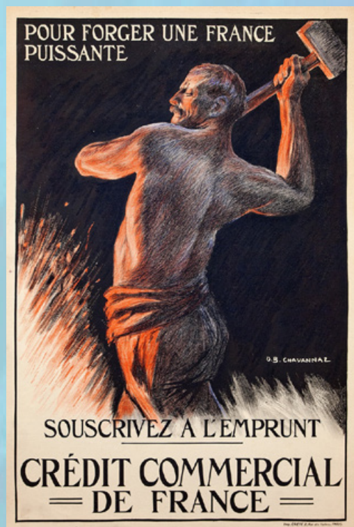
Chavannaz, David Burnand (1920) « Pour forger une France puissante » : affiche publicitaire du Crédit Commercial de France Tirée de la collection d'affiches de la Maison de l'Épargne