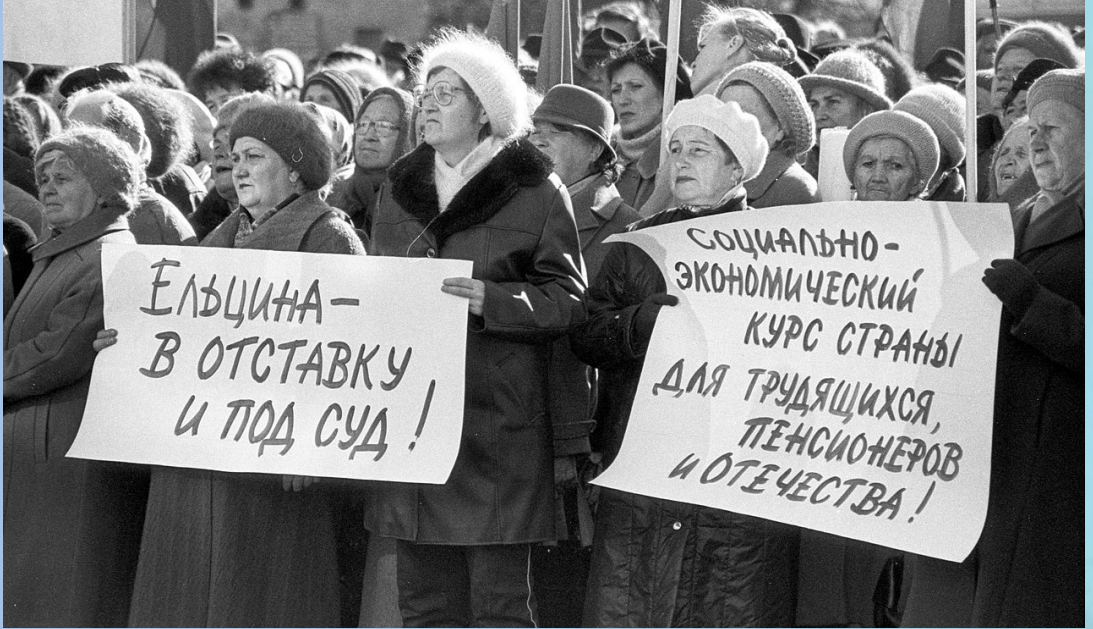
Meeting Octobre 1998.

Après la crise asiatique de 1997, l'économie russe est confrontée à une baisse sensible de ses exportations de matières premières du fait du ralentissement économique mondial. Le moratoire sur la dette intérieure et la dévaluation du rouble finissent par déclencher la panique, l'inflation et finalement une crise financière dans le pays.